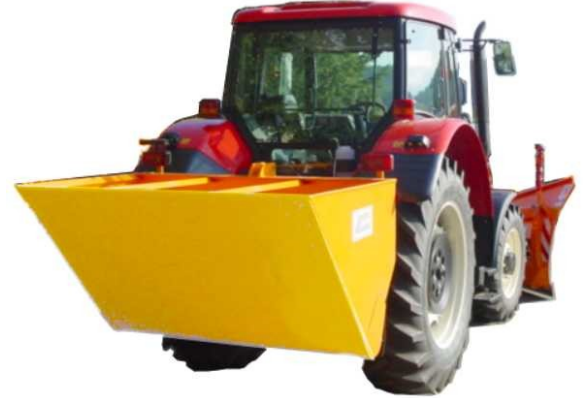
Iseki Kommunaltraktoren von 16 – 50 PS